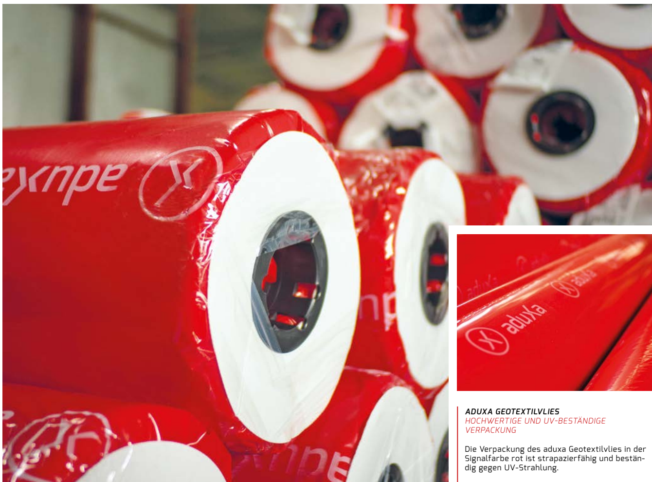
ADUXA GEOTEXTILVLIES HOCHWERTIGE UND UV-BESTÄNDIGE VERPACKUNG

Vliesstoffe mit höheren Grammaturen schützen Kunststoffdichtungsbahnen oder Rohre vor mechanischen Beschädigungen.